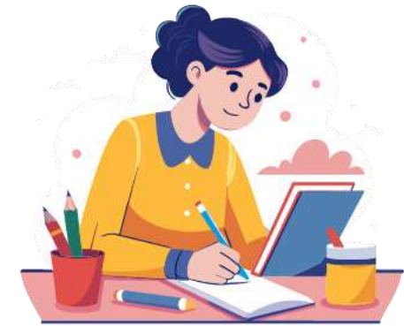
Tiền nhuận bút