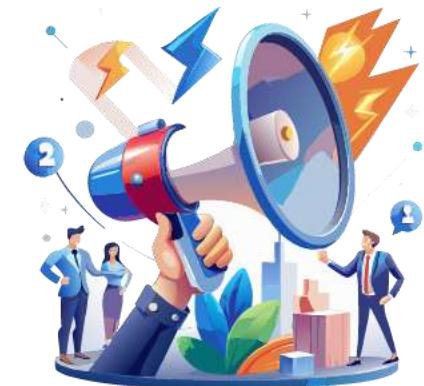
Tiền dịch vụ quảng cáo