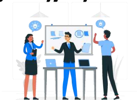
Ban kiểm soát