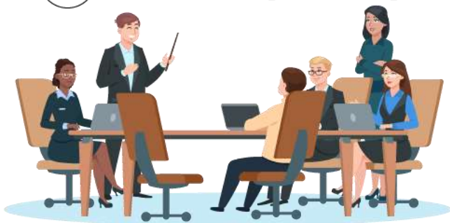
Hội đồng quản trị