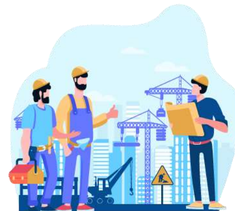
Ban quản lý dự án

Hội đồng quản lý, các hiệp hội, hội nghề nghiệp và các tổ chức khác