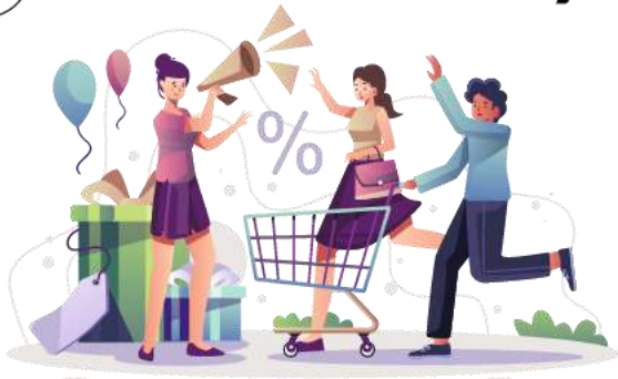
Hoa hồng bán hàng, môi giới