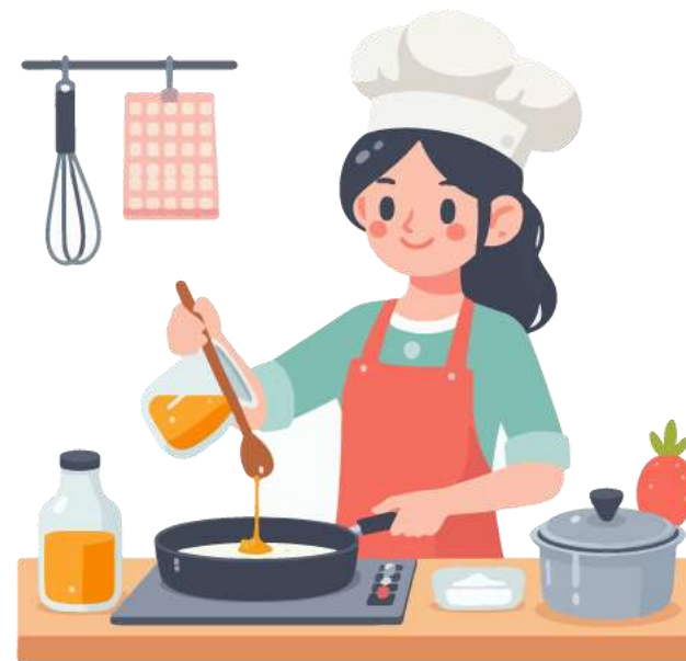
Nấu ăn, giúp việc gia đình