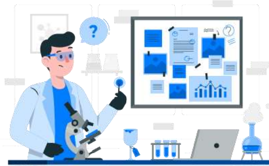
Tiền tham gia đề tài NCKH