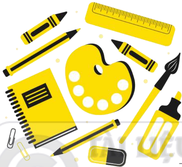
Văn phòng phẩm

đ 4 . Phần khoản chi cao hơn mức quy định của Nhà nước