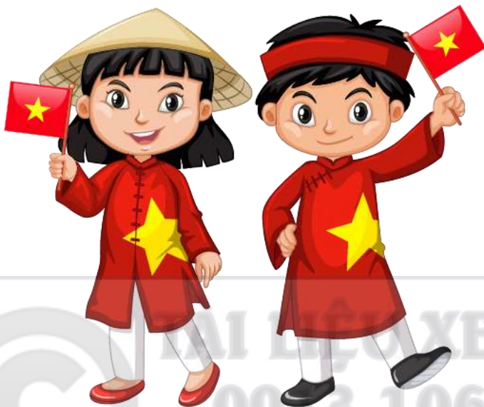
Chỉ các ngày nghỉ lễ