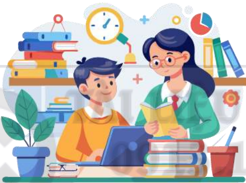
Tiền giảng dạy