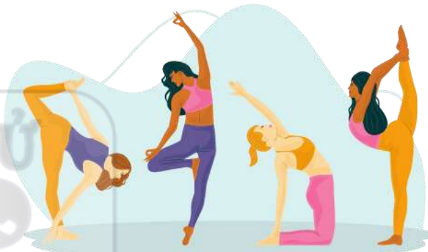
Biểu diễn VH, thể dục, thể thao