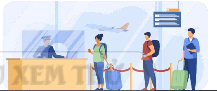
Công tác phí