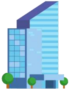
Công ty TNHH A

Mua cà phê từ nông dân trực tiếp trồng bán ra