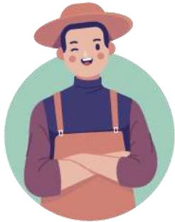
Hộ ông X

Mua lá chè của hộ trồng chè trực tiếp bán ra