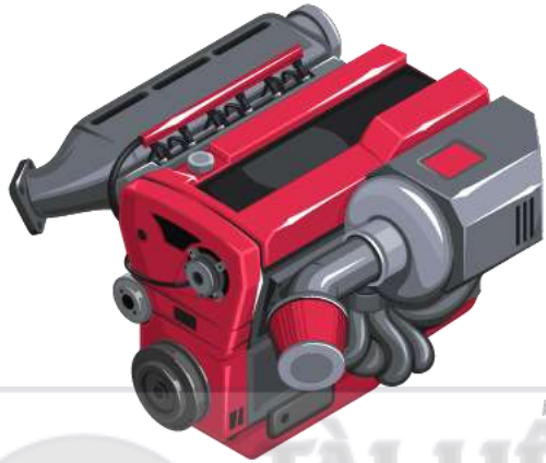
TSCĐ điều chuyển