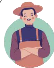
Hộ ông X

Kê khai, nộp thuế GTGT tỷ lệ 1% trên doanh thu