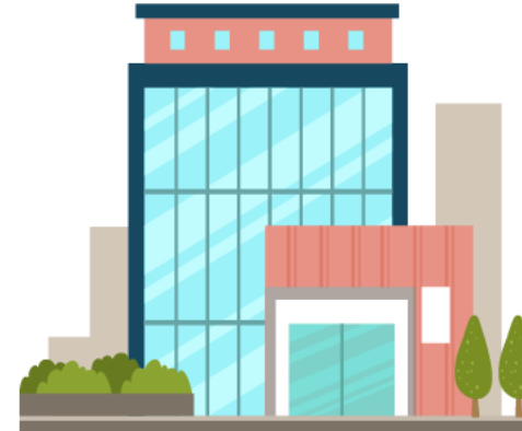
Công ty bảo hiểm B