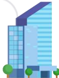
Công ty TNHH A