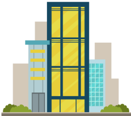
Công ty A